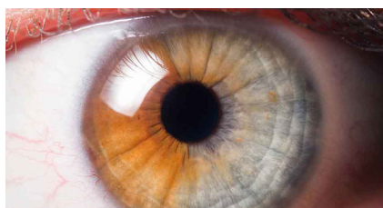
אבחון דרך גלגל העין

שיעור חווייתי שלוקח אותנו לעולמו הקסום של הדמיון. ע"י טכניקה שנלמד בשיעור נוכל לכוון את כוח הדמיון המדהים שלנו לשליטה על תהליכי גוף / נפש.